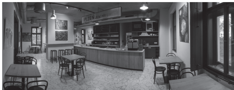
↳ stylová nádražní kavárna Moving Café s kapacitou 50 osob