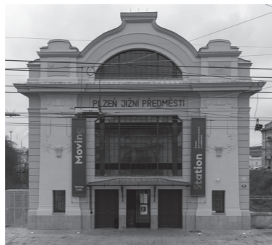
↳ pohled na secesní průčelí budovy Moving Station

Moving Station je svébytná alternativní plzeňská scéna pro současné divadlo, tanec a mezioborové umělecké experimenty, která již od roku 2000 hostí umělce z celého světa. Moving Station je také vhodným místem pro konání vašich konferencí, firemních akcí, festivalů, přednášek, představení, koncertů, výstav, vernisáží, filmových projekcí, přátelských či uměleckých setkání, svateb a oslav.