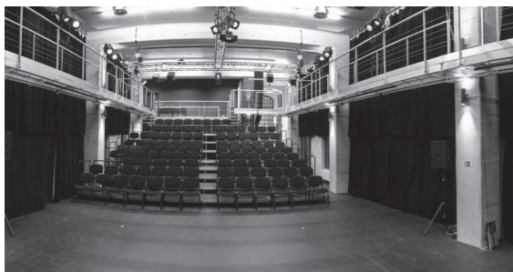
↳ velký sál o rozměrech 20 × 10 × 6 m, s variabilním využitím a kapacitou 100–250 osob

Moving Station nabízí pestrou kombinaci čtyř samostatných prostor: