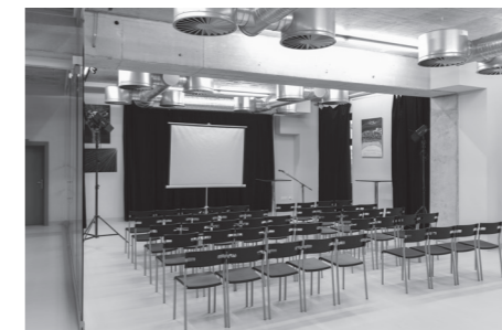
↳ malý konferenční a výstavní sál s kapacitou 80 osob