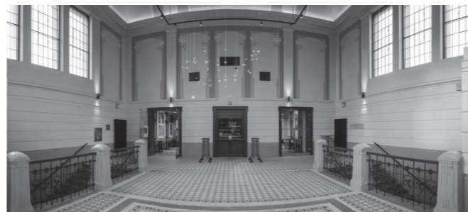
↳ vstupní secesní hala v původní podobě z roku 1904